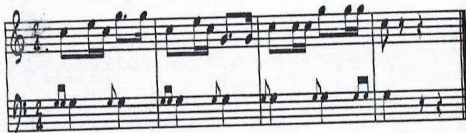
FIGURA No. 212