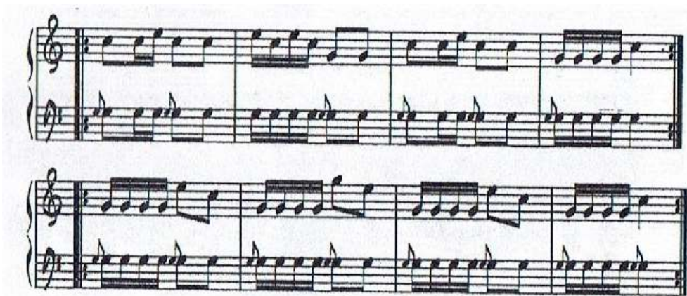
FIGURA No. 262