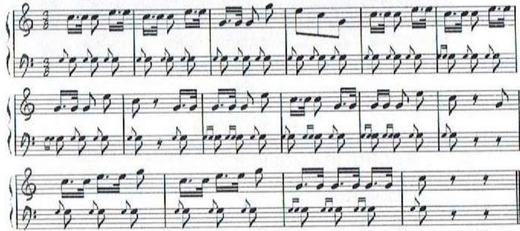
FIGURA No. 307