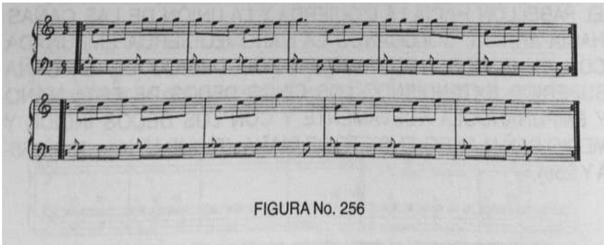
FIGURA No. 256