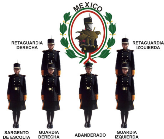
FORMACIÓN DE LA ESCOLTA DE BANDERA NACIONAL