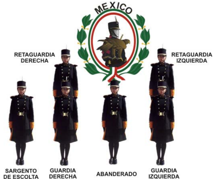
FORMACIÓN DE LA ESCOLTA DE BANDERA NACIONAL

2010, año del Bicentenario de nuestra Independencia Nacional y Centenario de la Revolución Mexicana